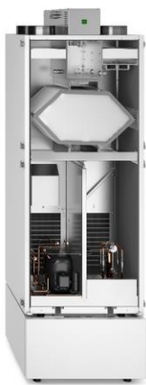
WRG 334-HK-L mit Unterbauschrank

Achtung: Kühlfunktion nur verwenden, wenn Zuluftleitungen dampfdicht isoliert sind. An nicht isolierten Leitungen kann sich Kondensat bilden!