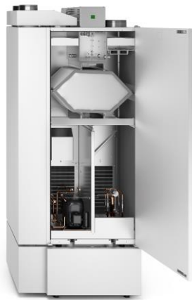
WRG 334-SL-H mit Unterbauschrank